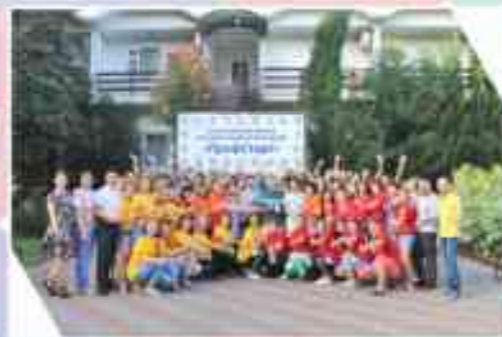
Профсоюзный форум молодых педагогов «ПрофСтарт»