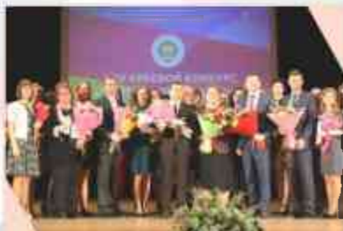
Краевой профессиональный конкурс «Учитель года Кубани»

Экономическая эффективность правозащитной работы составила более 111 миллионов рублей.