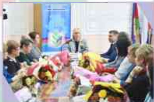
Торжественная церемония награждения педагогов-наставников

В рамках сотрудничества с отраслевым министерством поощряются участники профессиональных конкурсов и педагогические работники – наставники обучающихся, показавших достижения во Всероссийской олимпиаде школьников и региональных олимпиадах.