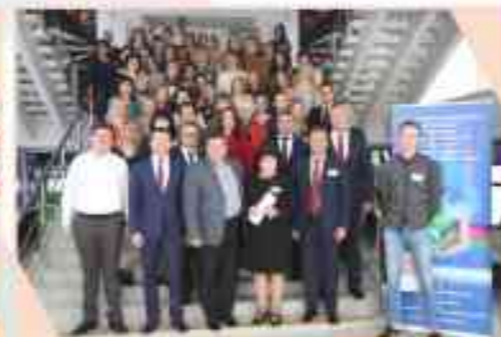
Всероссийская научно-практическая конференция «Роль и место Профсоюза в XXI веке: актуальные вопросы социального партнерства»